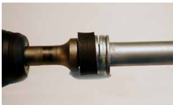
Monteringsbild 1. Demontera det främre handtaget och sätt in slagstiftet i chucken.