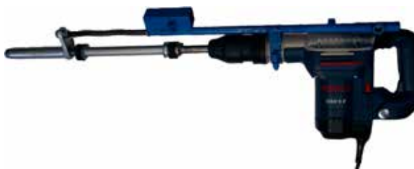
Monteringsbild 5. Nu är det klart att börja spika fast dina spikade kantstöd.