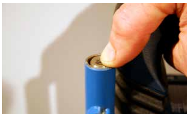
Monteringsbild 4. Justera in parallellstaget så att parallellstaget är i nivå med signalrörets överkant när slagstiftet är nere i sitt nedersta läge genom att flytta klämringens läge på maskinens hals (spåret för det främre handtaget) och skruva fast klämringen. Räcker inte detta finns det justeringsmöjligheter på den gängade stängen som håller fast den slitsade hylsan lossa då båda muttrarna och skruva upp/ner den övre muttern och lås fast parallellstaget med den undre muttern.