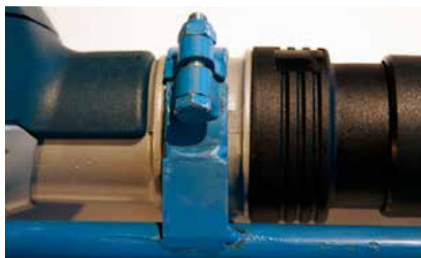
Monteringsbild 2. Montera klämringen runt halsen på maskinen bakom chucken (där det främre handtaget har suttit) men dra inte fast skruvarna helt.